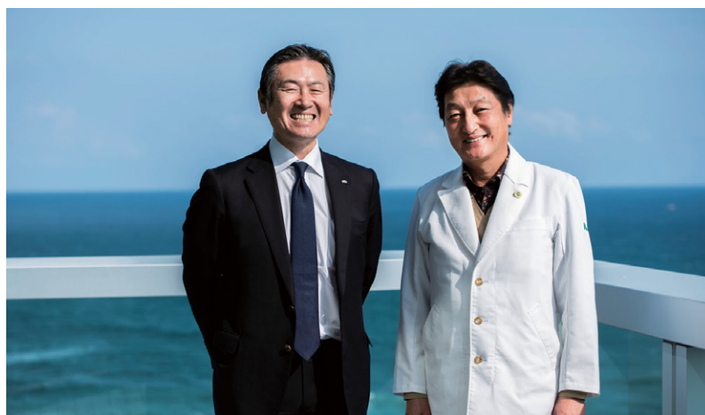
■医療法人鉄蕉会 亀田総合病院 鉄蕉会は鴨川市を中心に、千葉・東京・神奈川に病院3施設、クリニック6施設を有す医療法人。2020年4月現在、総職員数3,928人。中心をなす亀田総合病院は、病床数917床の高度急性期病院。千葉県南部の基幹病院として、救急医療から小児医療、周産期医療、在宅医療まで地域の医療ニーズに応じて幅広い医療提供体制を整えている。ISO9001の認証取得のほか、国際的な医療機能評価であるJCI認証を日本で初めて取得し、世界水準の医療を提供している。

用名 亀田グループの事業姿勢そのものが地域への貢献なのですね。地域包括ケアの本当の意味が理解できたと思います。当社も、もっと社会の役に立っていきたくて、思いを新たにしました。