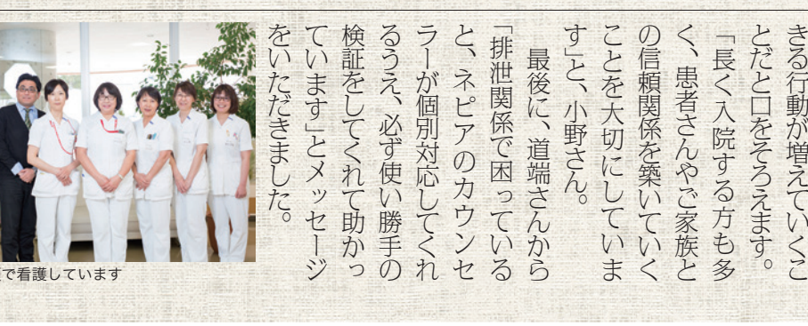
笑顔で看護しています

「病院にいながら四季の移り変わりがわかるほど、自然環境に恵まれていることが何よりです。桜も紅葉も窓から楽しめます。そのお蔭か、患者さんもお話してくれます。た〜話します。ここでは、患者さんの本来持っている自然回復力や生きる力を損なわない医療・看護・介護を心がけています。リハビリ環境も充実しているほか、歯科治療室があり、口腔ケアにも注力しています。